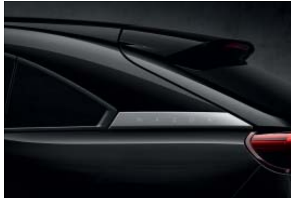
Jet Black Mica