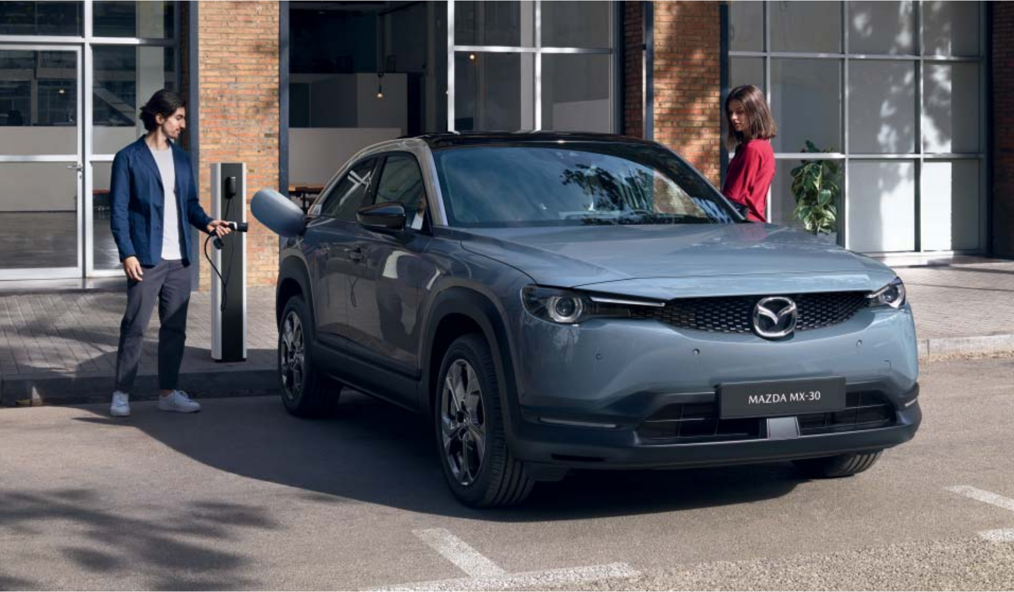
Foto boven: Mazda MX-30 als Luxury uitvoering in Polymetal Gray Metallic 3-Tone Foto's links: Mazda MX-30 als Luxury uitvoering met industrieel interieur