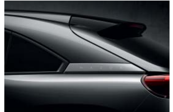
Machine Gray Metallic