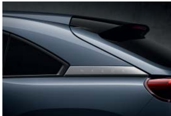
Polymetal Gray Metallic