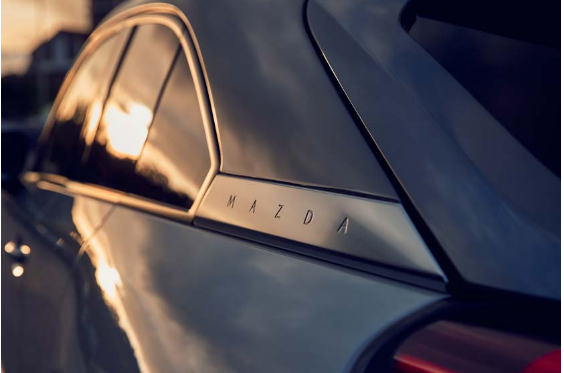
Foto: Mazda MX-30 als Luxury uitvoering in Ceramic Metallic 3-Tone