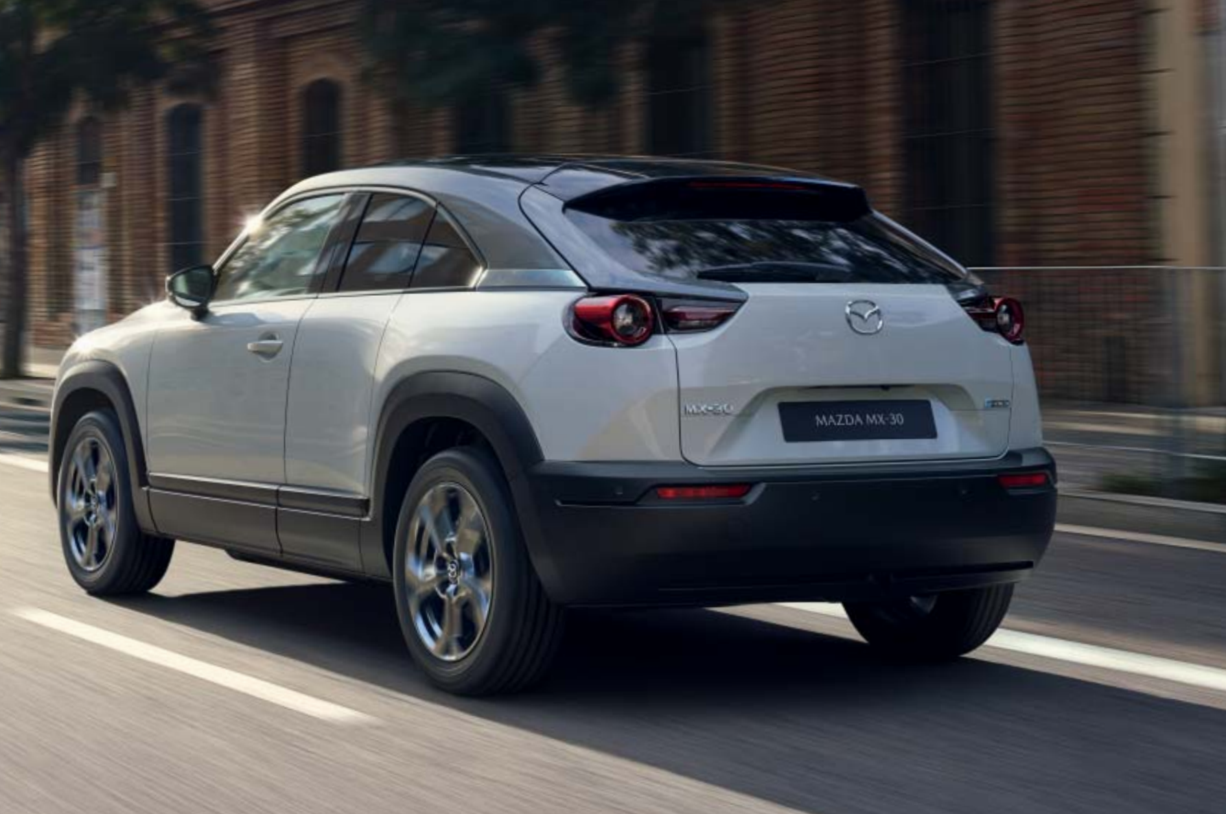
Foto: Mazda MX-30 als Luxury uitvoering in Ceramic Metallic 3-Tone