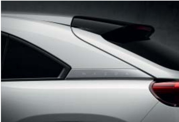
Arctic White Solid