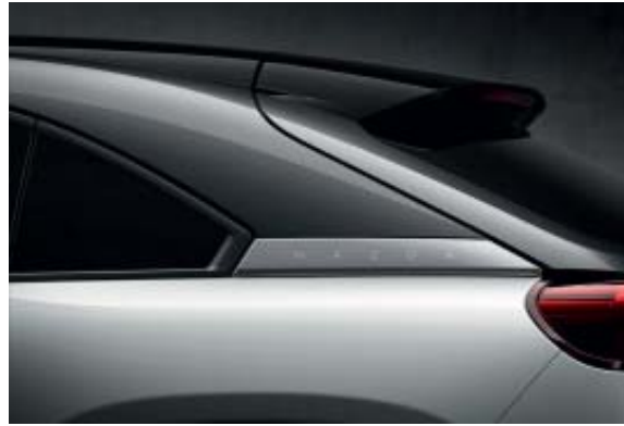
Ceramic Metallic 3-Tone