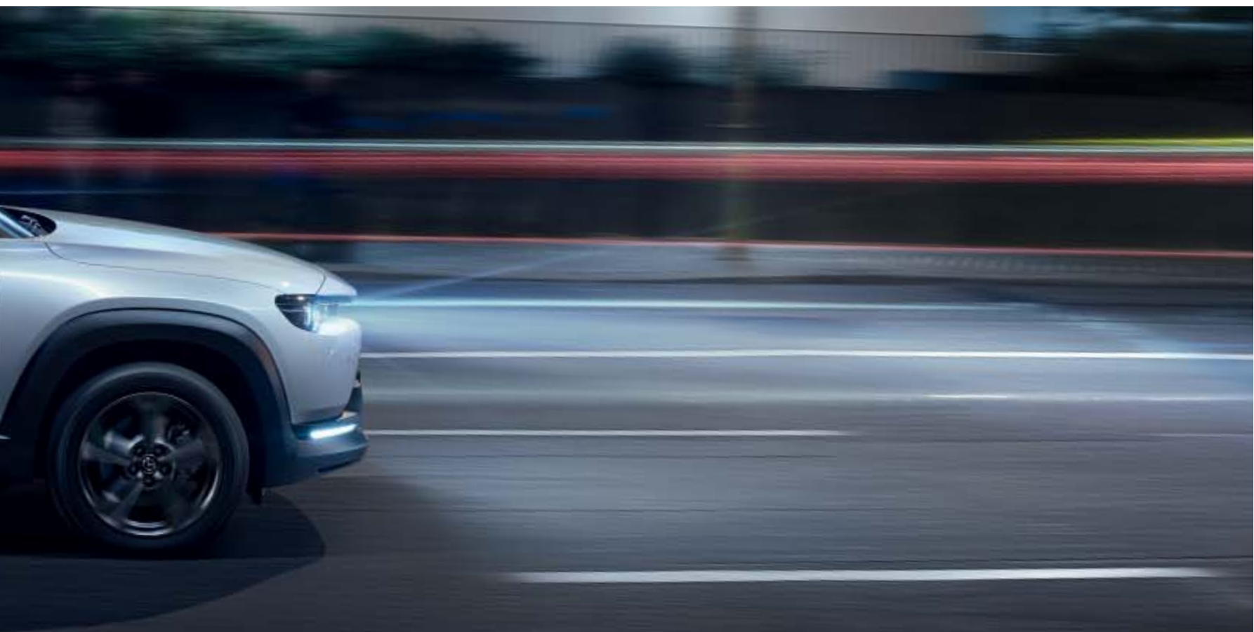
Foto: Mazda MX-30 als Luxury uitvoering in Ceramic Metallic 3-Tone