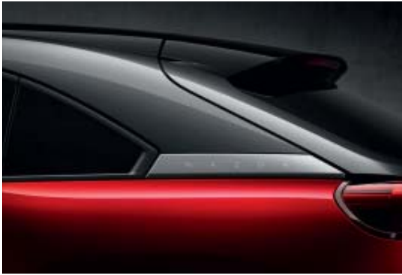
Soul Red Crystal Metallic 3-Tone