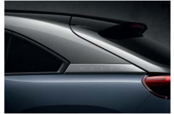
Polymetal Gray Metallic 3-Tone