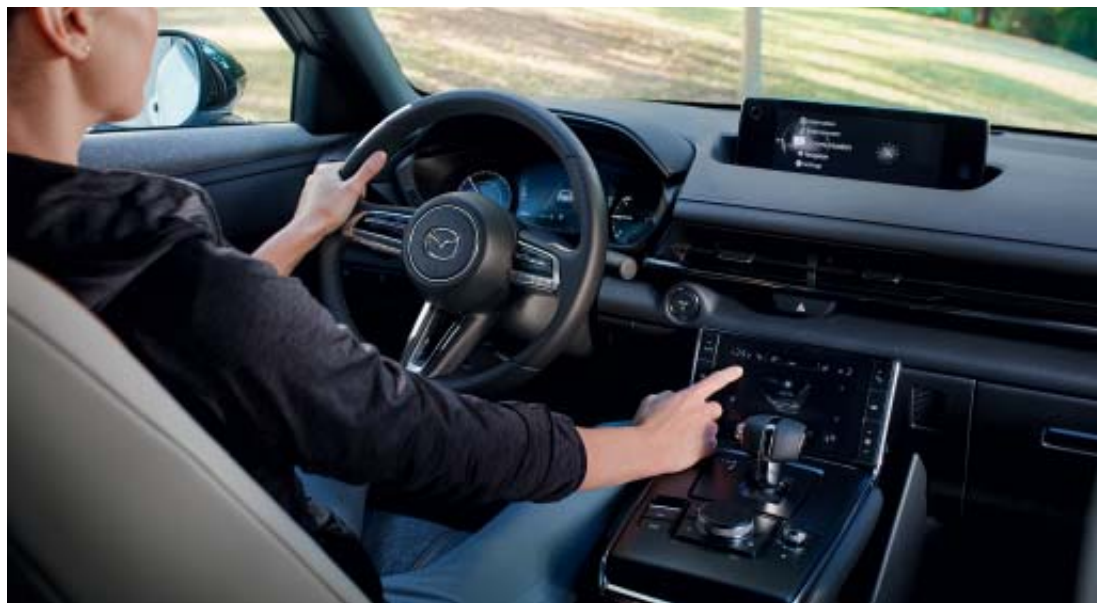
Foto links en rechts: Mazda MX-30 als Luxury uitvoering in Ceramic Metallic 3-Tone met modern interieur

Met Mazda's designfilosofie Kodo – Soul of Motion is het alsof elke nieuwe Mazda altijd in beweging is, ook als hij stilstaat. Ontworpen door mensenhanden, voor mensen. Puur vakwerk waarbij Mazda's Takumi (vakmensen) met de hand, en een speciaal voor Mazda ontwikkelde slijpsteen, de vorm bepalen. De essentie blijft, maar met een ziel in het design. Die verbondenheid is uniek en typisch Mazda. Het enige wat je wil, is plaatsnemen en wegrijden.