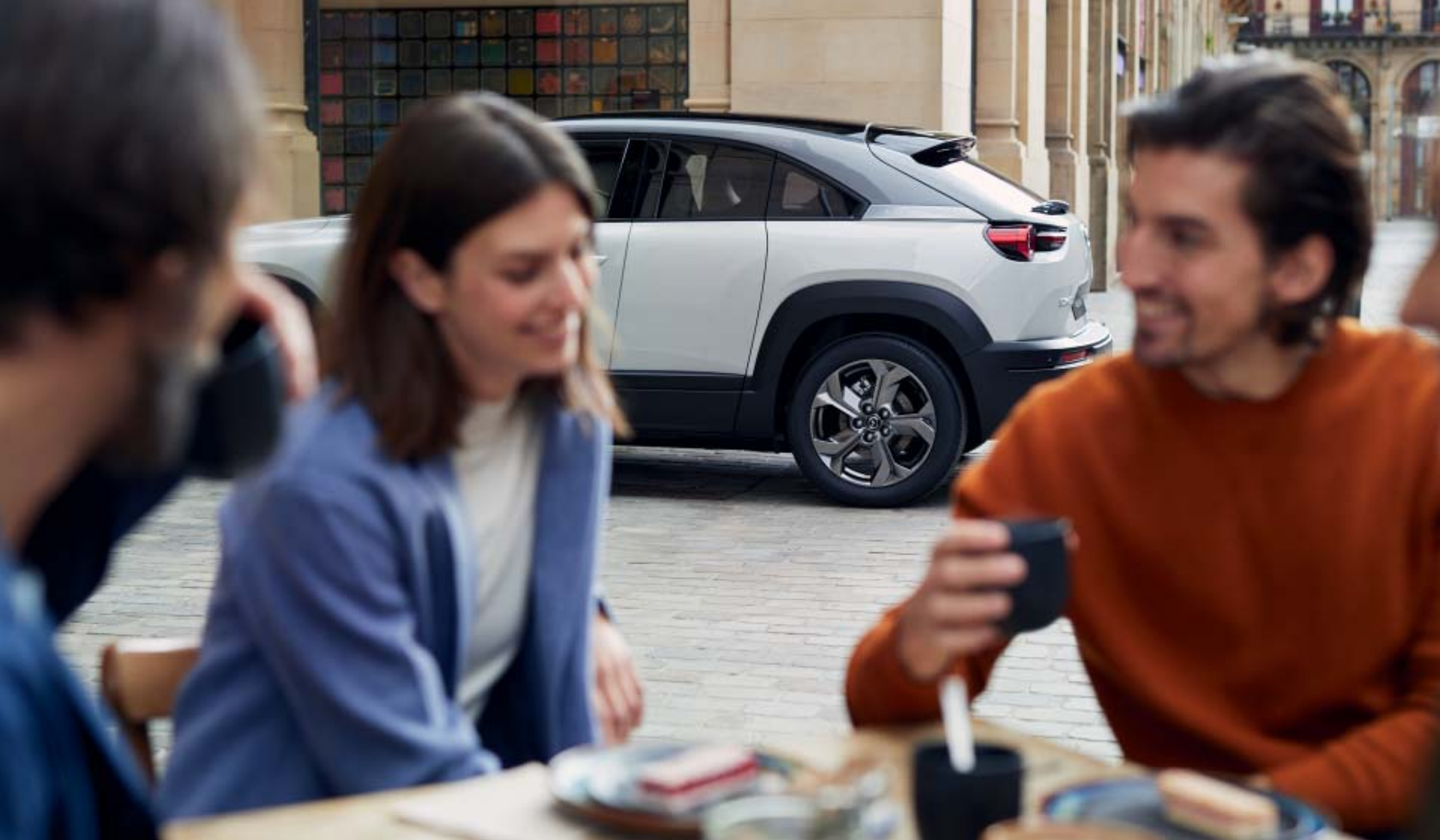
Foto: Mazda MX-30 als Luxury uitvoering in Ceramic Metallic 3-Tone