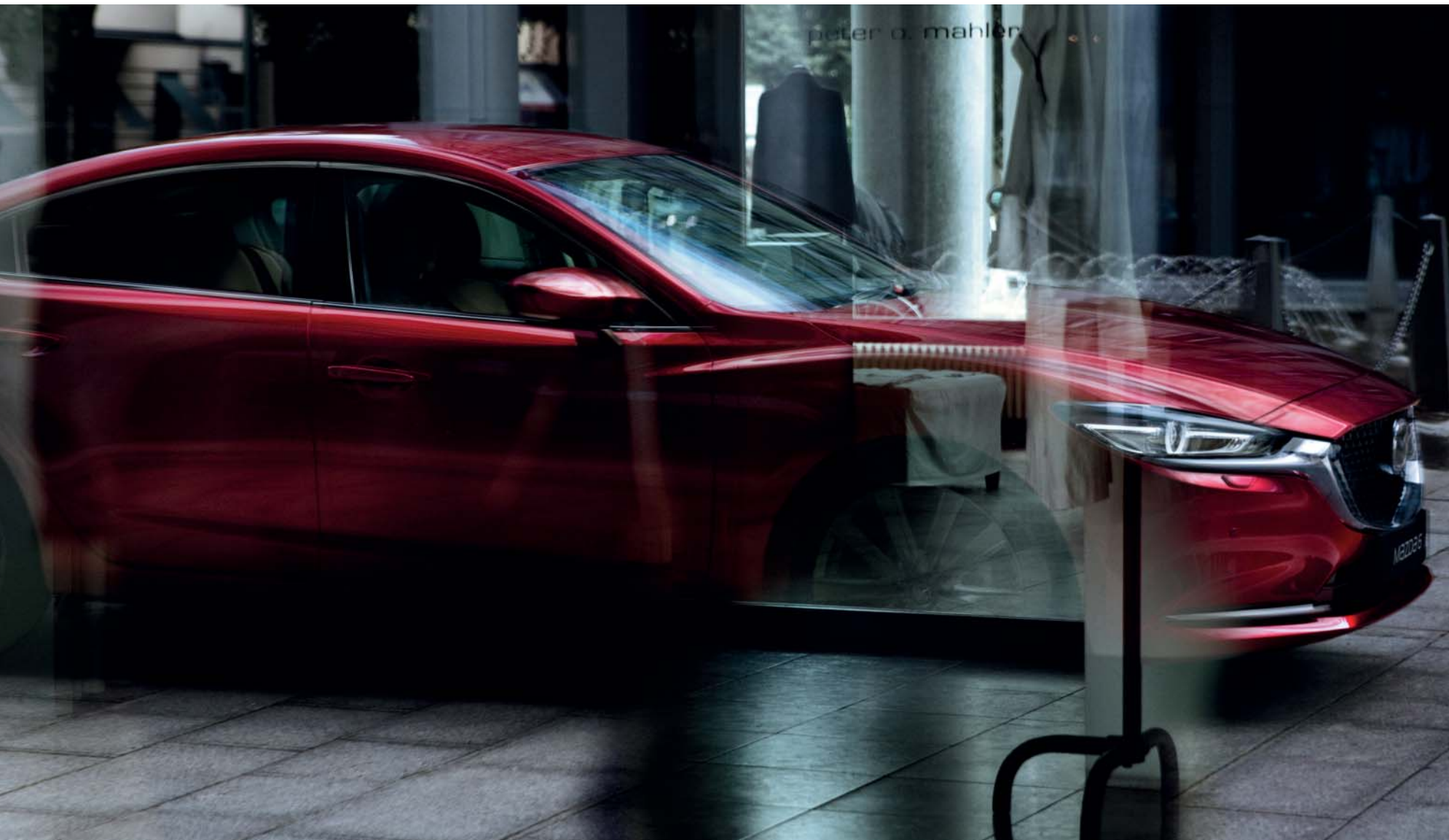
Foto: Mazda6 Sedan als Signature uitvoering in Soul Red Crystal