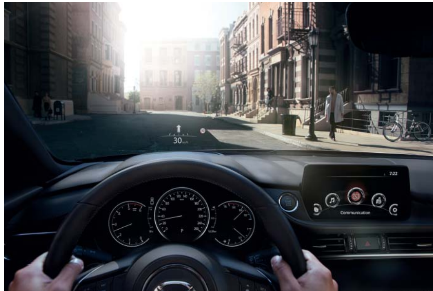
Foto boven: Mazda6 als Luxury uitvoering met Active Driving Display en 7-inch digitale meterset Foto links: Mazda6 als Signature uitvoering in Soul Red Crystal