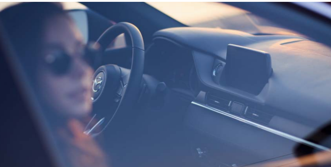
Foto rechts: Mazda6 Sedan als Signature uitvoering in Soul Red Crystal.

Maar daar houdt de luxe om te kiezen niet op. Op basis van smaak en representativiteit kun je kiezen uit verschillende uitvoeringen. Zo is er de scherp geprijsde Business-uitvoering, gunstig voor je bijtelling. De dynamische Sportive-uitvoering met zwarte wielen, stijlvol donkerrood leer en sportieve accenten. En bij de Luxury-uitvoering gaan we nog een stap verder in pure luxe. De luxe om te kiezen in optima forma.