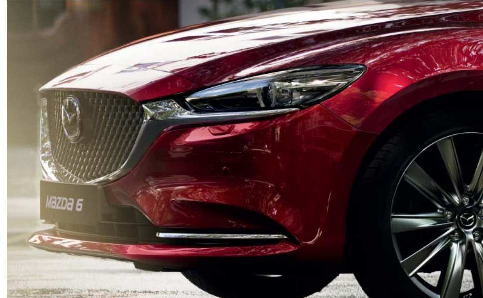
Foto links boven: Mazda6 als Signature uitvoering, 19-inch lichtmetalen velg in Bright Silver