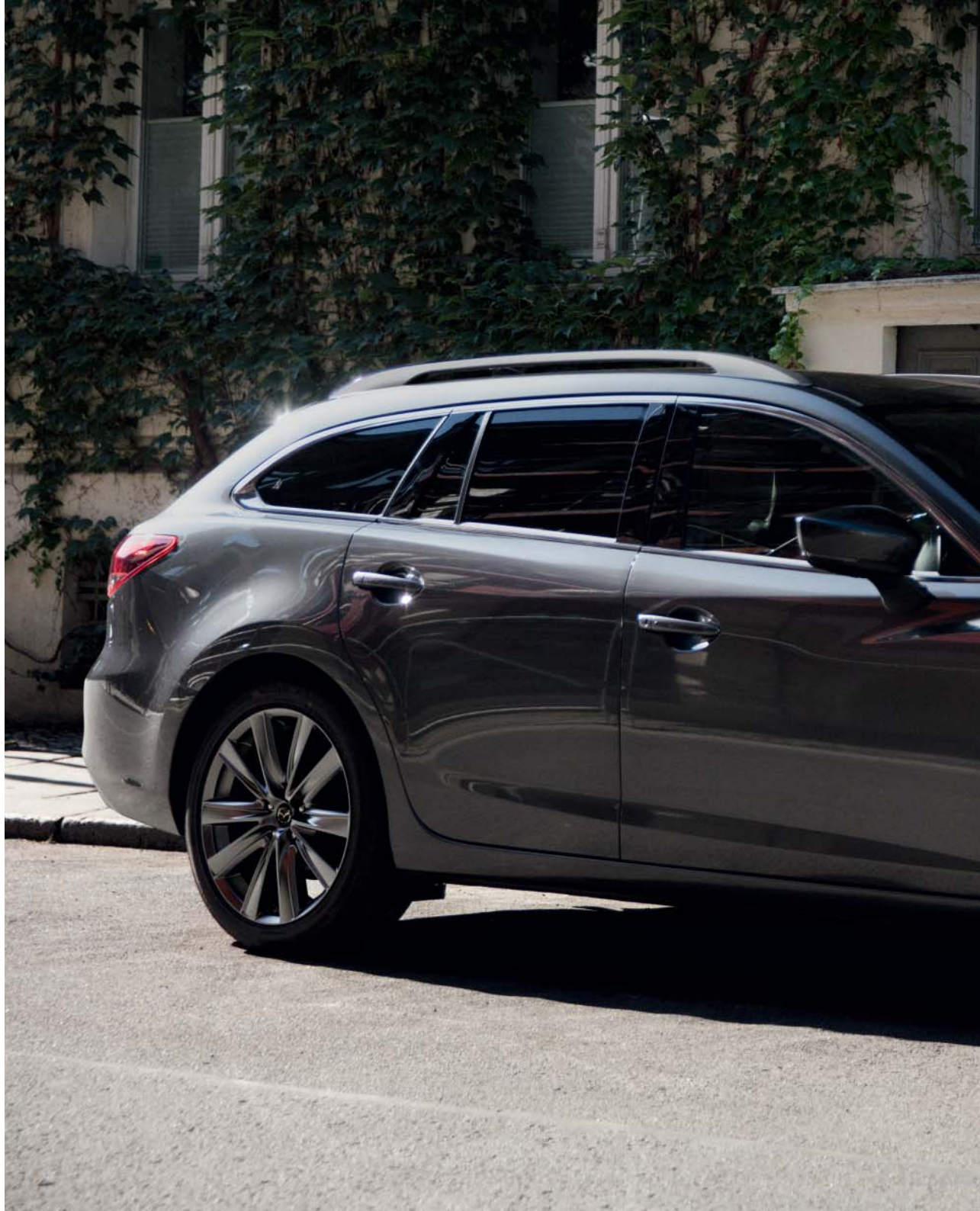
Foto rechts: Mazda6 Sportbreak als Signature uitvoering in Machine Gray