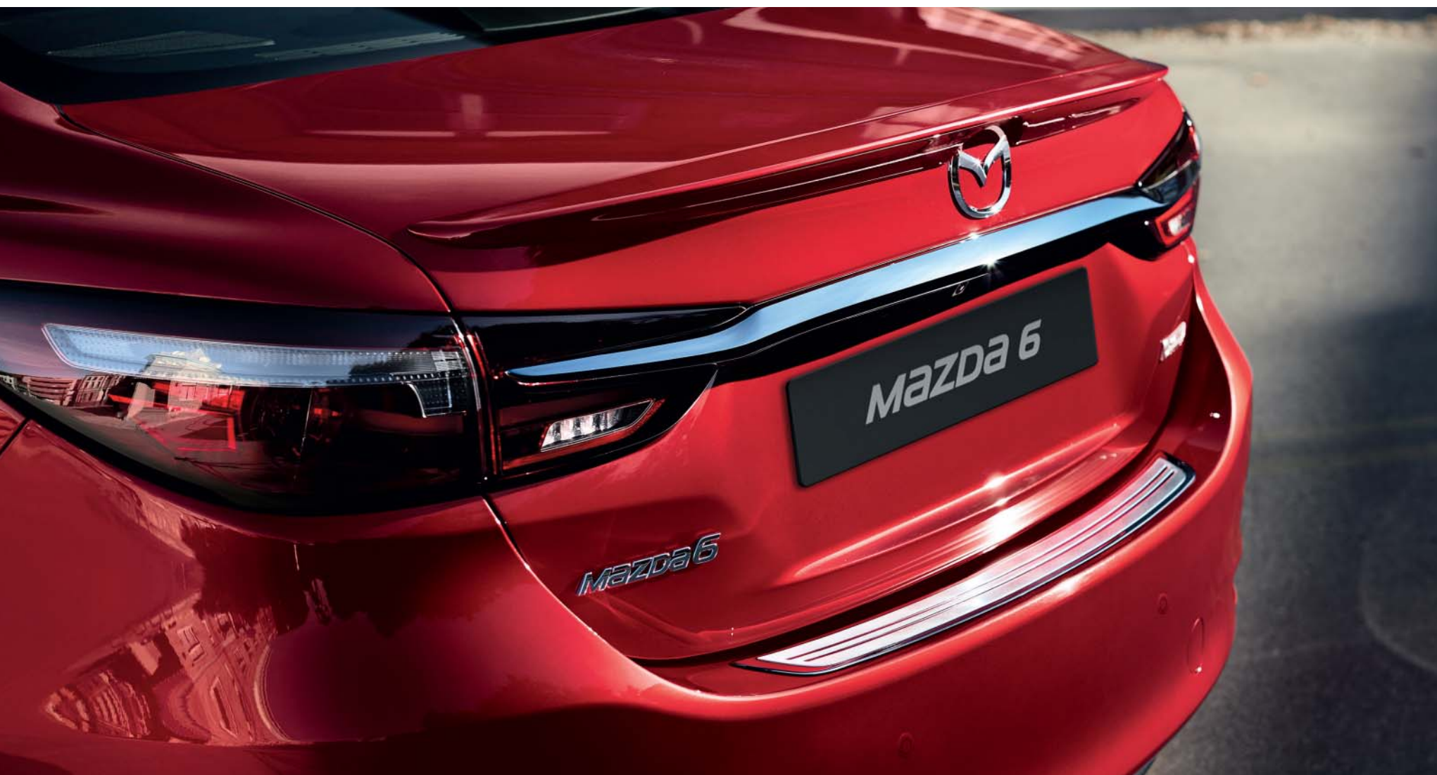
Achterspoiler en beschermplaat achterbumper