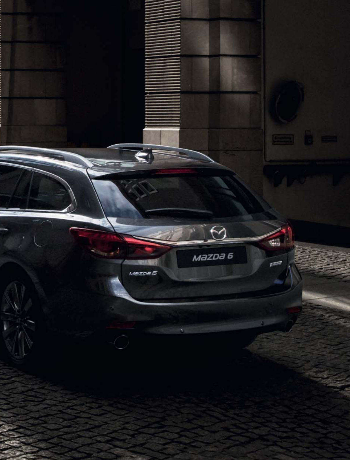
Foto links: Mazda6 Sportbreak als Signature uitvoering in Machine Gray